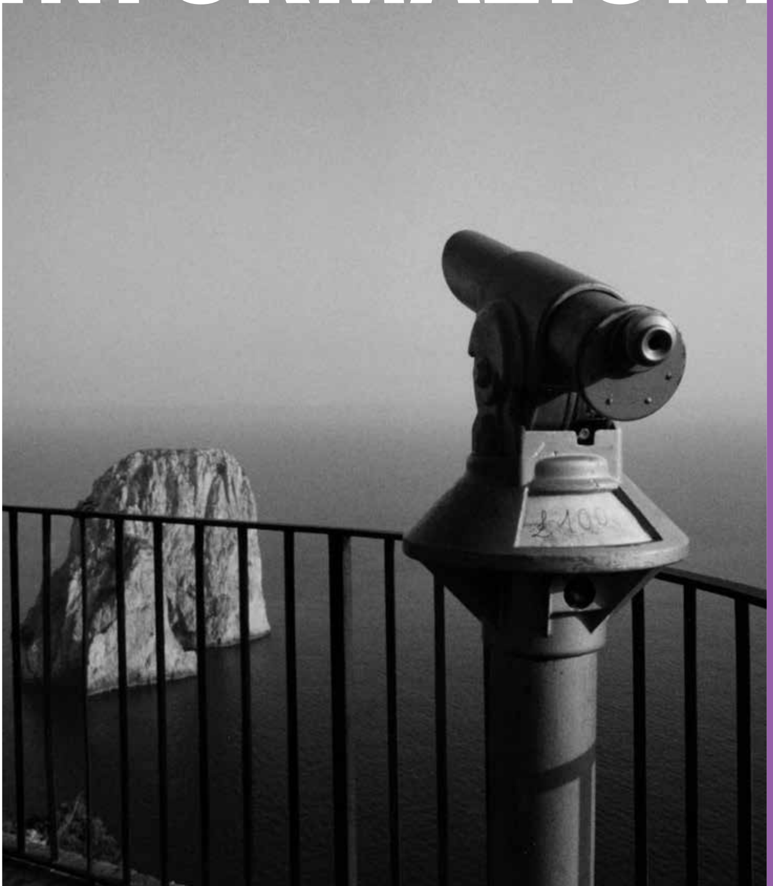
Luigi Ghirri, Capri 1982 - Viaggio in Italia 1984 , Padiglione Italia alla 55. Esposizione Internazionale d'Arte, La Biennale di Venezia